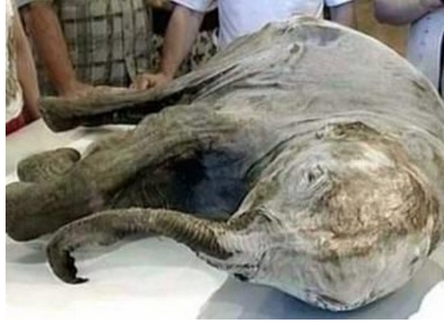
Bébé de mammouth âgé de 40000 ans découvert en Sibérie